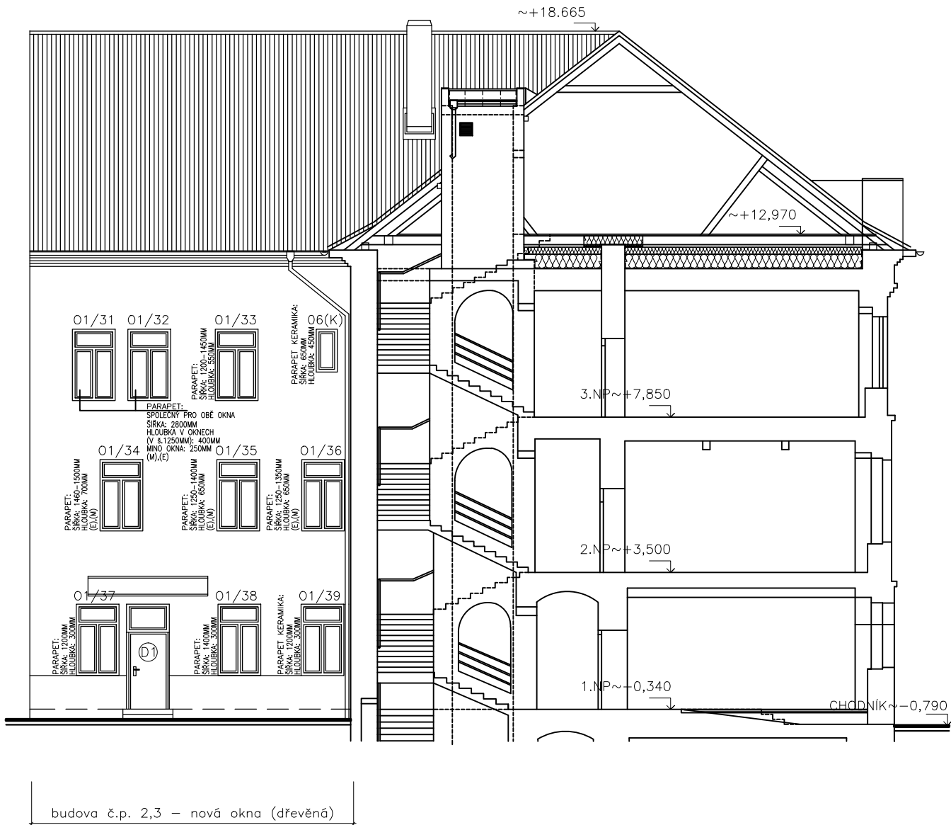
POHLED SEVERNÍ – DO DVORA ŘEZOPOHLED A–A TÉŽ DOPLŇUJÍCÍ VÝKRES K PŮDORYSU PODKROVÍ–ZATEPLENÍ